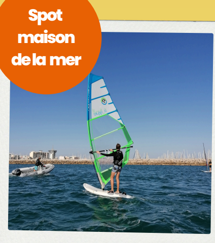
Planche à Voile 12 ans à Adulte

Maîtrisez les techniques avancées pour plus de glisse.