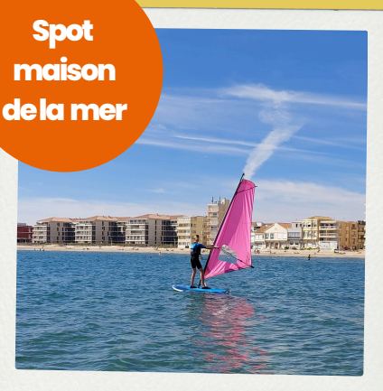
Planche à Voile

Découvrez la sensation de glisse avec du matériel adapté